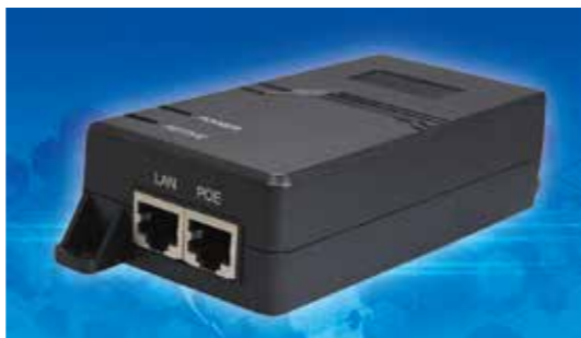
RoHS指令10物質準拠製品です。