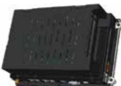
拡張スロット搭載モデル